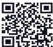
แบบขออนุญาต