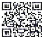
แบบขอย้าย